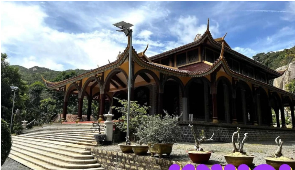
Thien vien truc lam chan nguyen tat ca