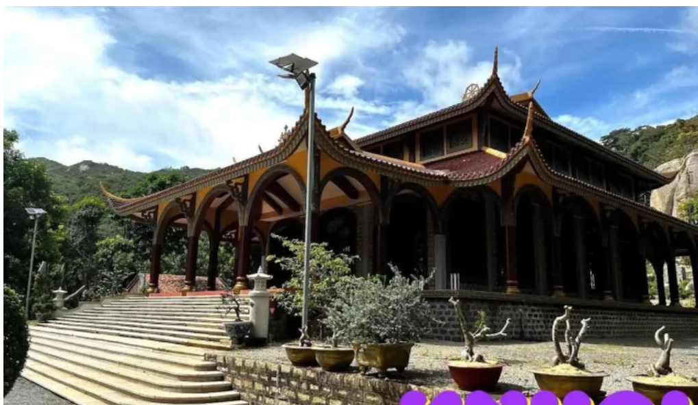
Thi?n vi?n truc lam chan nguyen ba r?a v?ng tau