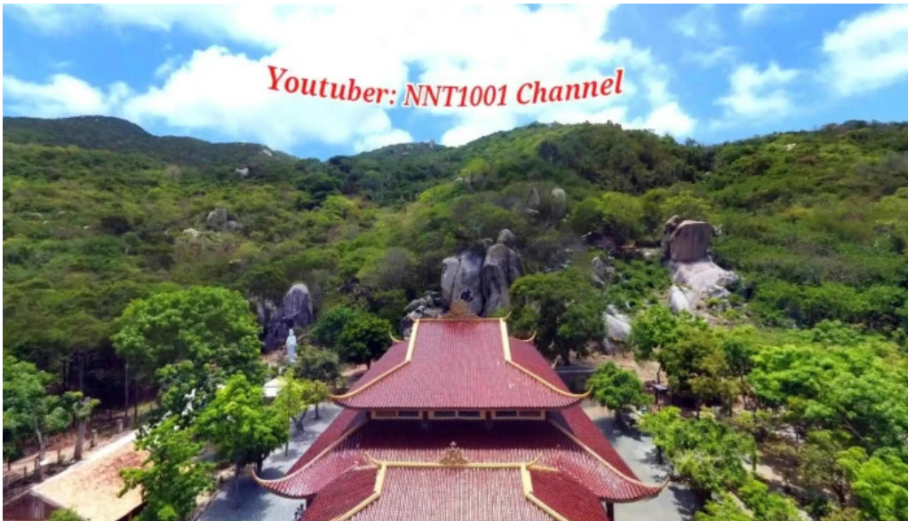
Thien vien truc lam chan nguyen che do xem pho va 360deg