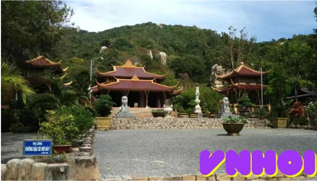
Thien vien truc lam chan nguyen video