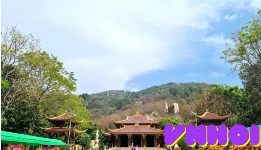
Thien vien truc lam chan nguyen moi nhat