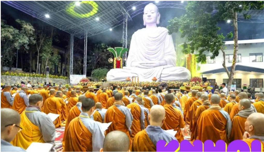
Thien ton phat quang tat ca