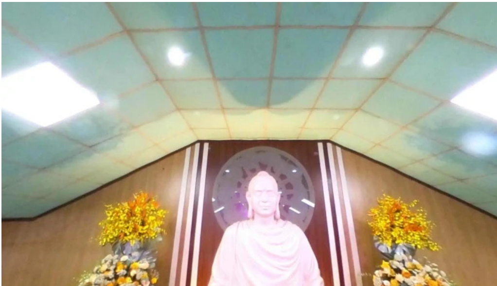
Thien ton phat quang che do xem pho va 360deg