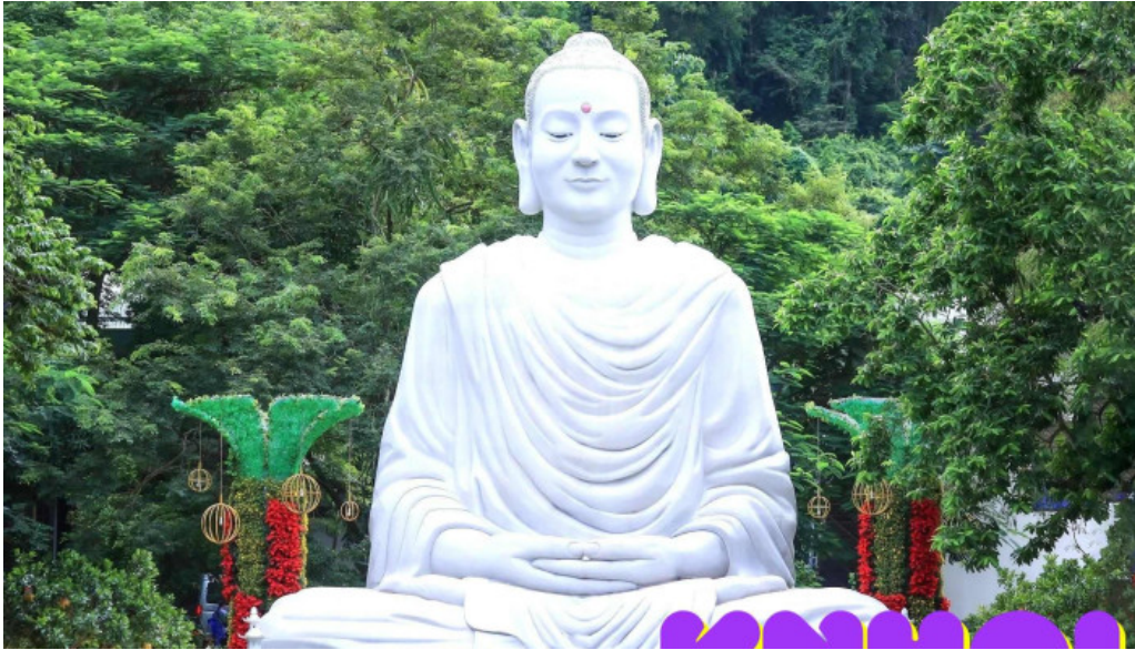
Thien ton phat quang của chu so huu