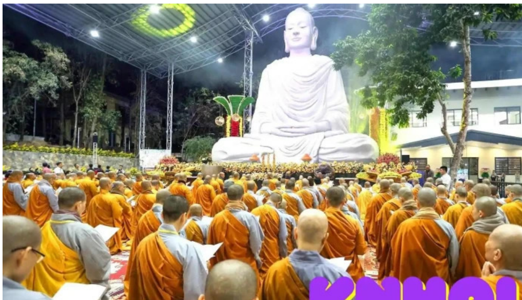
Thi?n ton ph?t quang ba r?a v?ng tau