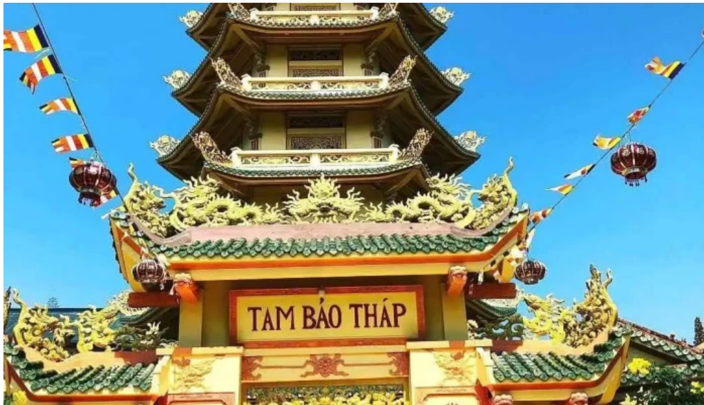
Chùa van phat quang dai tong lam tu tat ca