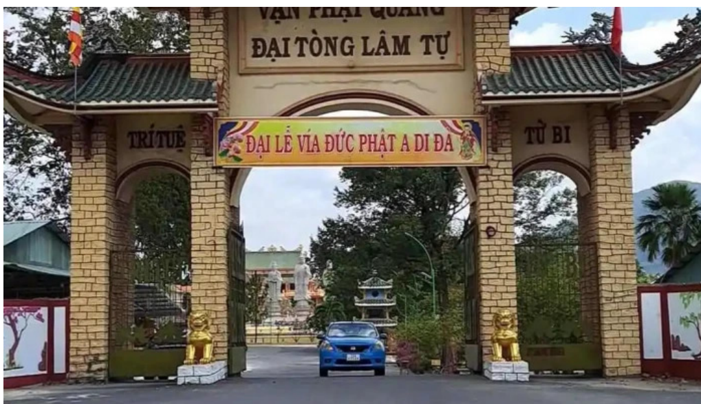
Chùa van phat quang dai tong lam tu video