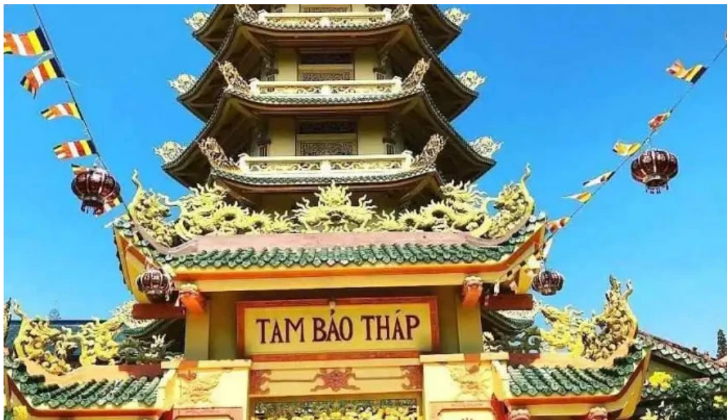
Chùa v?n ph?t quang ??i tông lam t? ba r?a v?ng tau