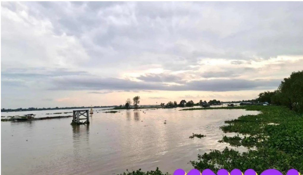
Ben pha phong hoa thoi an tat ca