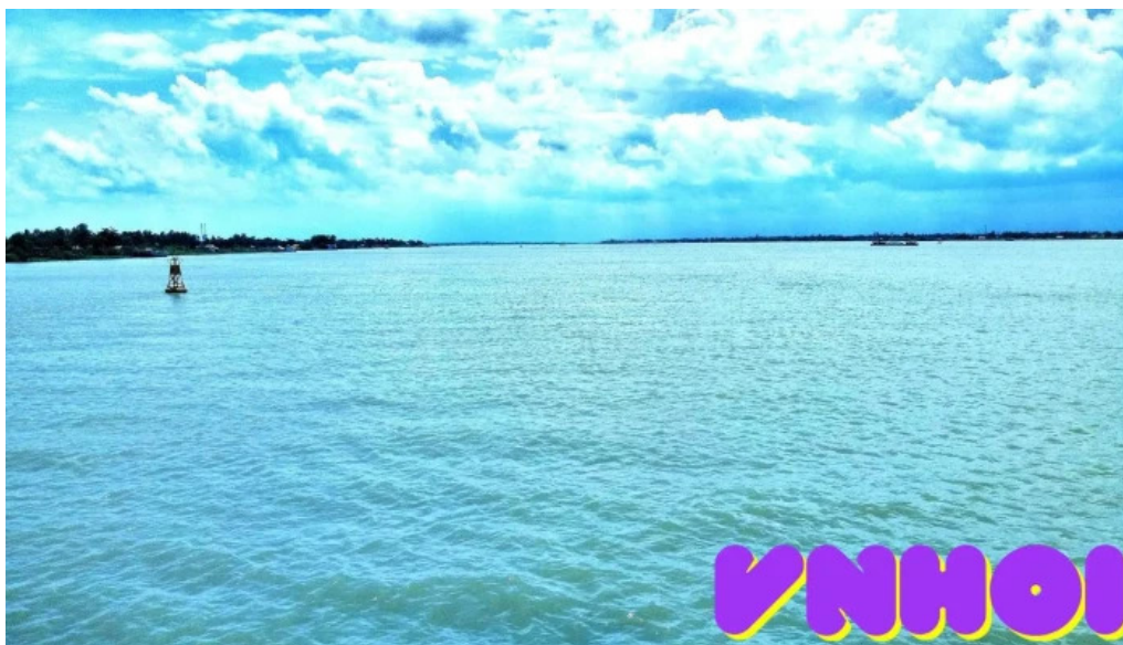
Ben pha phong hoa thoi an bien