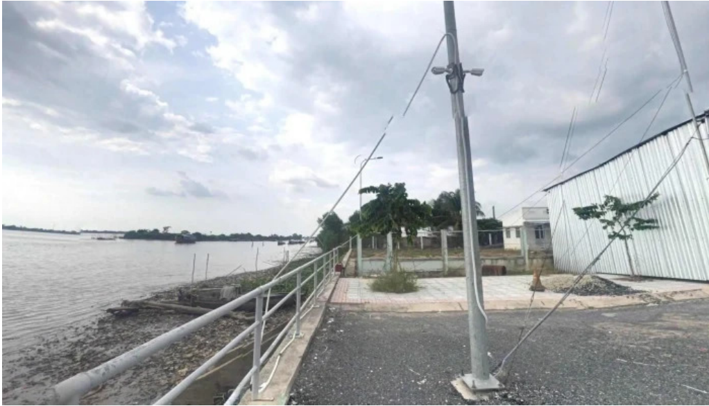
Ben pha phong hoa thoi an che do xem pho va 360deg