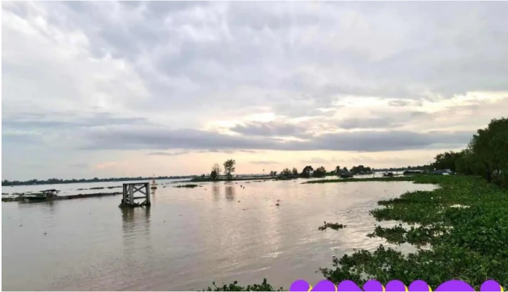
Bên pha phong hoa thi an ảnh chụp