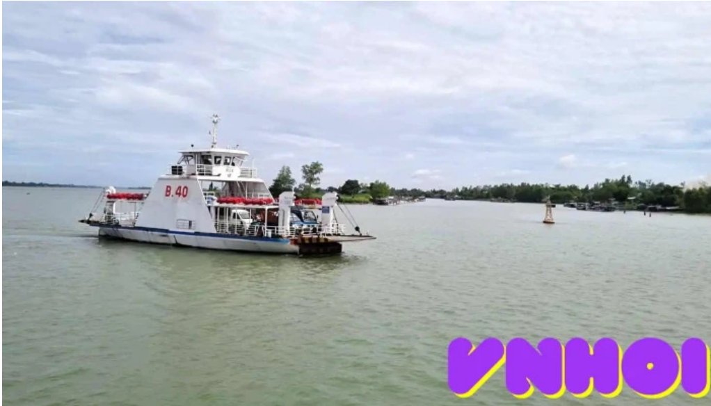
Ben pha phong hoa thoi an thuyen