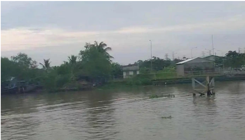
Bên pha phong hoa thời an video