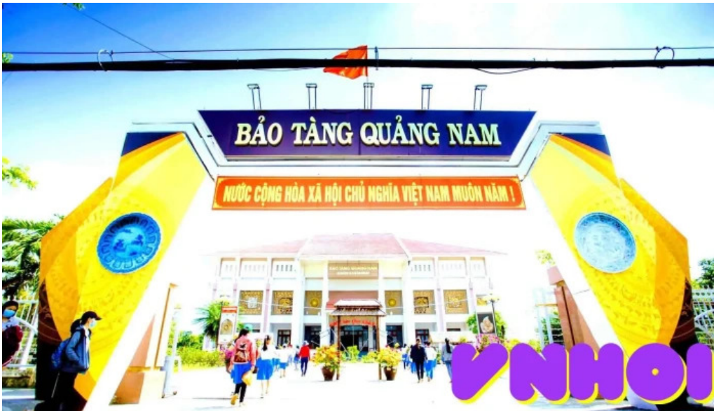
Bao tang tinh quang nam tat ca