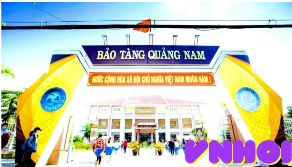
B?o tang t?nh qu?ng nam qu?ng nam