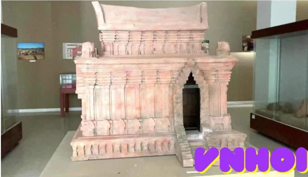
Bao tang tinh quang nam video