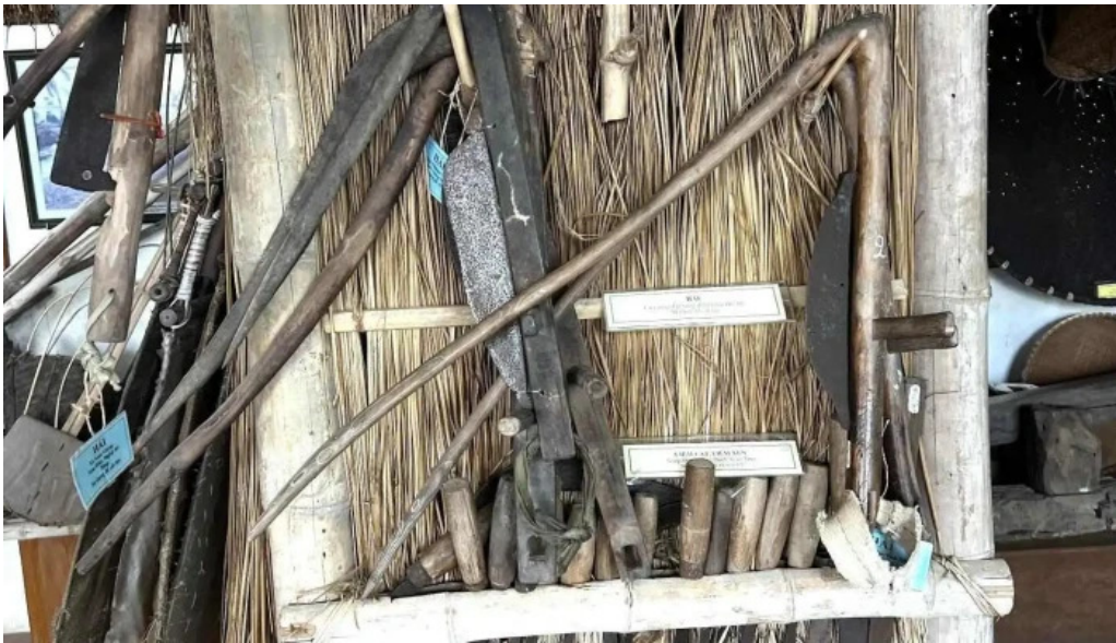
Bao tang dong que moi nhat