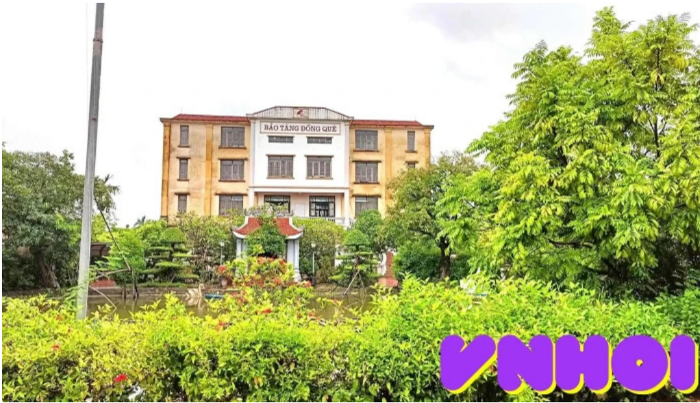
Bao tang dong que tat ca