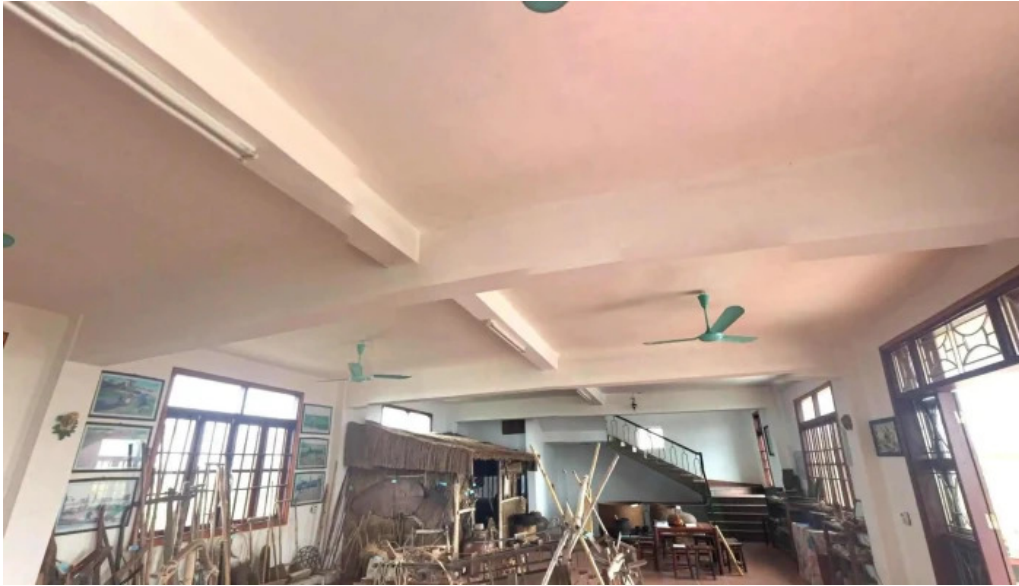
Bao tang dong que che do xem pho va 360deg