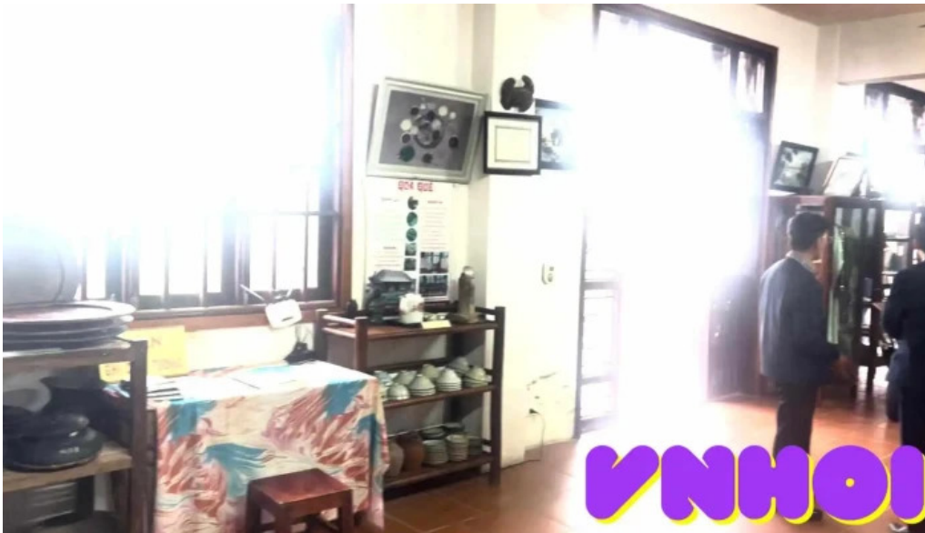
Bảo tàng Đông Quốc video