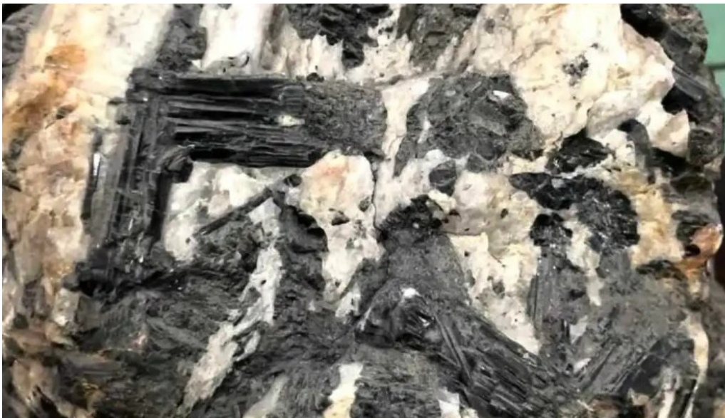
Bao tang địa chất video