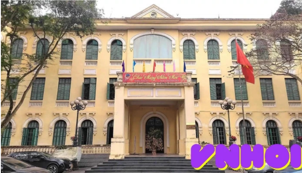
Bao tang dia chat tat ca