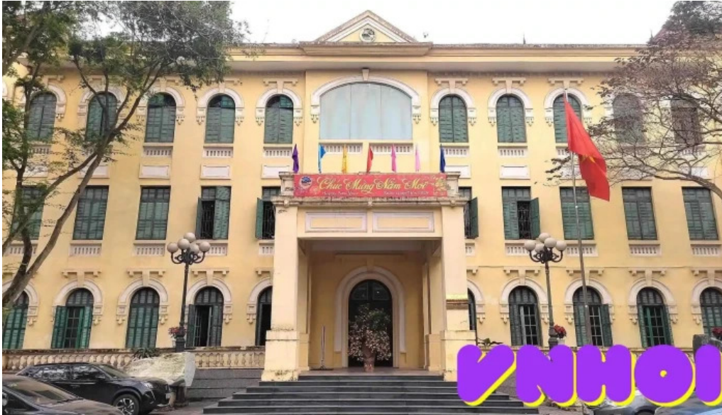
Bộ tang của cha n?