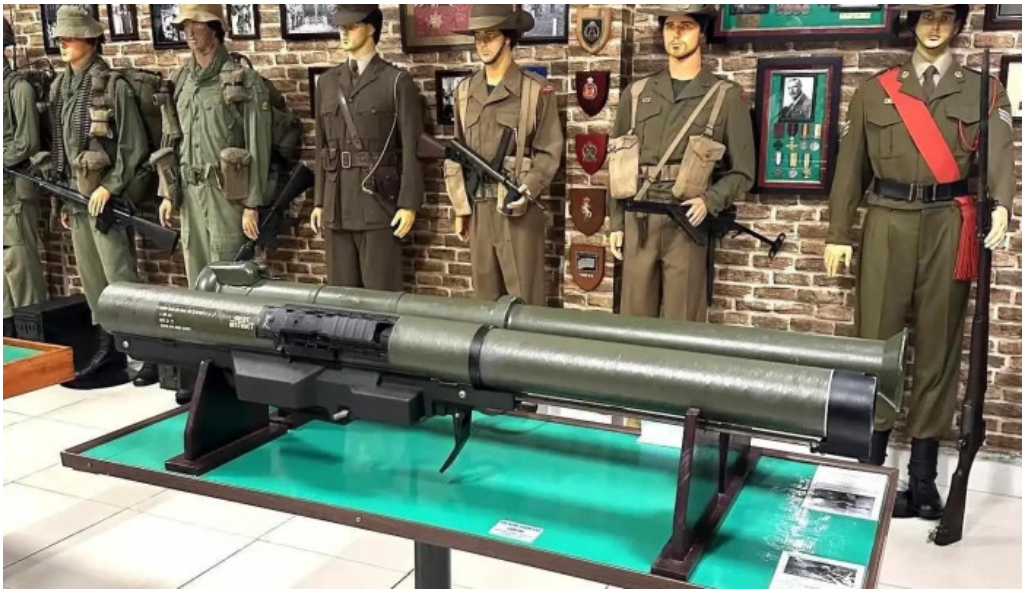
Bao tang vu khi co robert taylor moi nhat