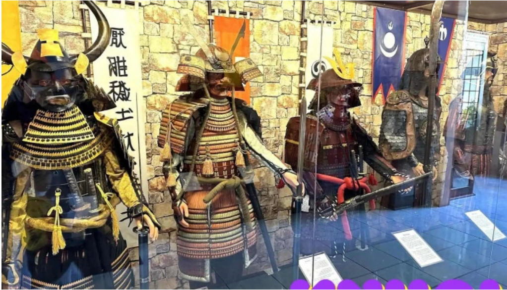
Bao tang vu khi co robert taylor tat ca