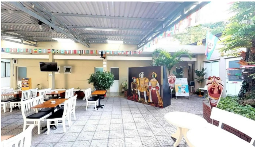
Bao tang vu khi co robert taylor che do xem pho va 360deg