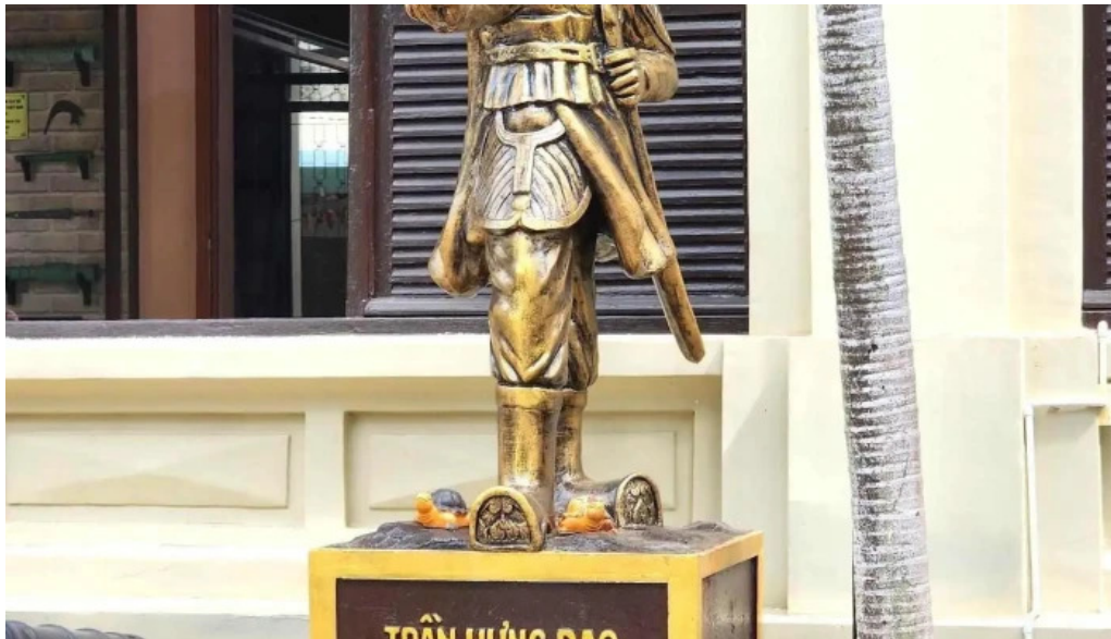
Bao tang vu khi co robert taylor dieu khac