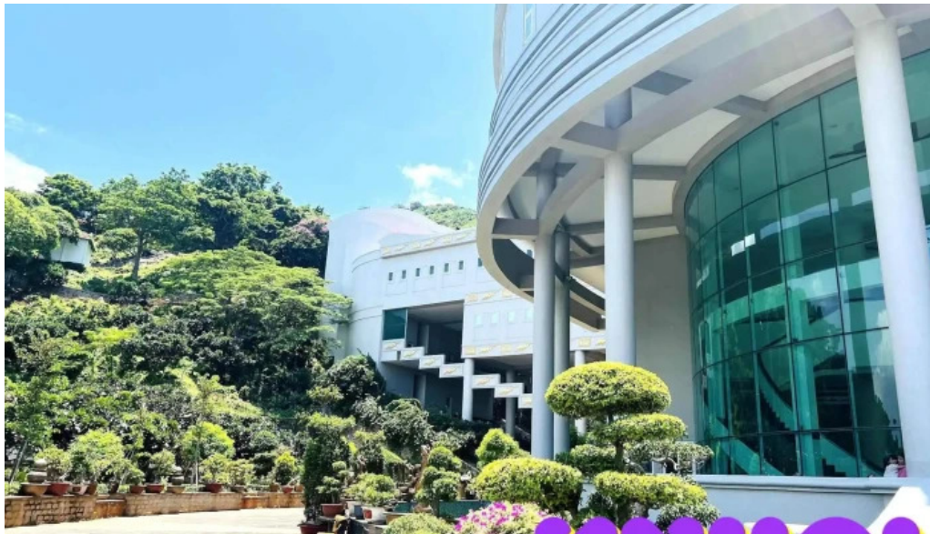
Bao tang ba ria vung tau tat ca