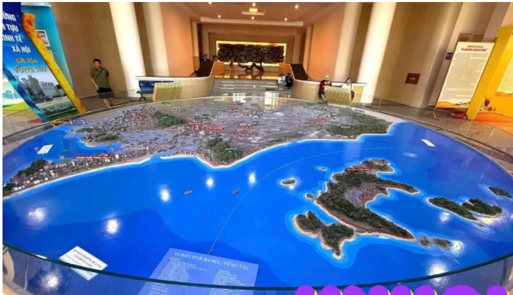
Bao tang ba ria vung tau moi nhat