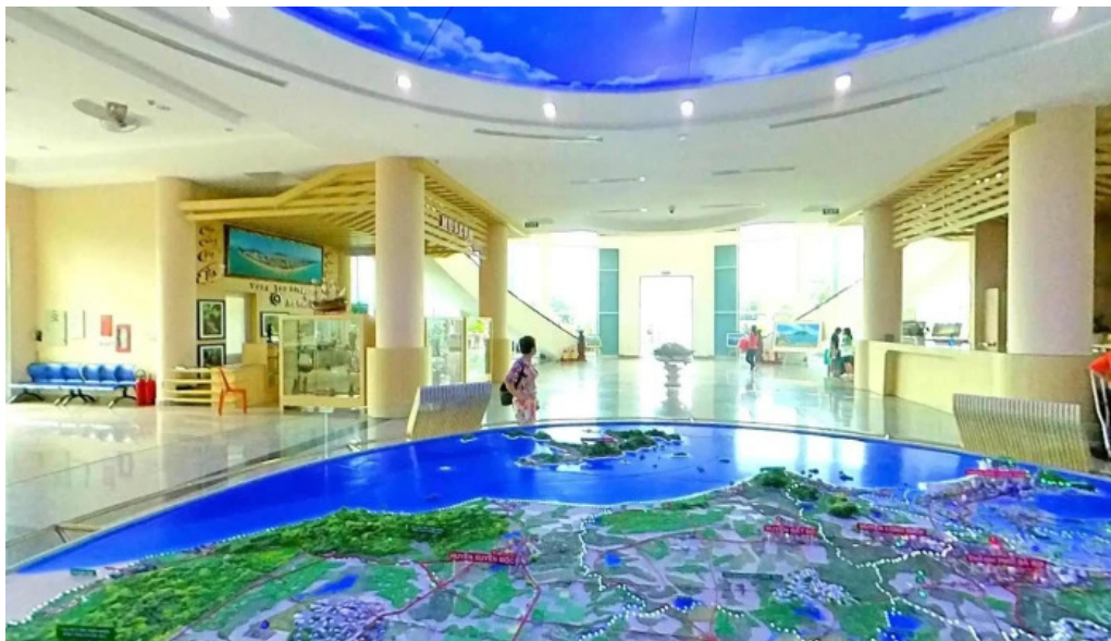
Bao tang ba ria vung tau che do xem pho va 360deg