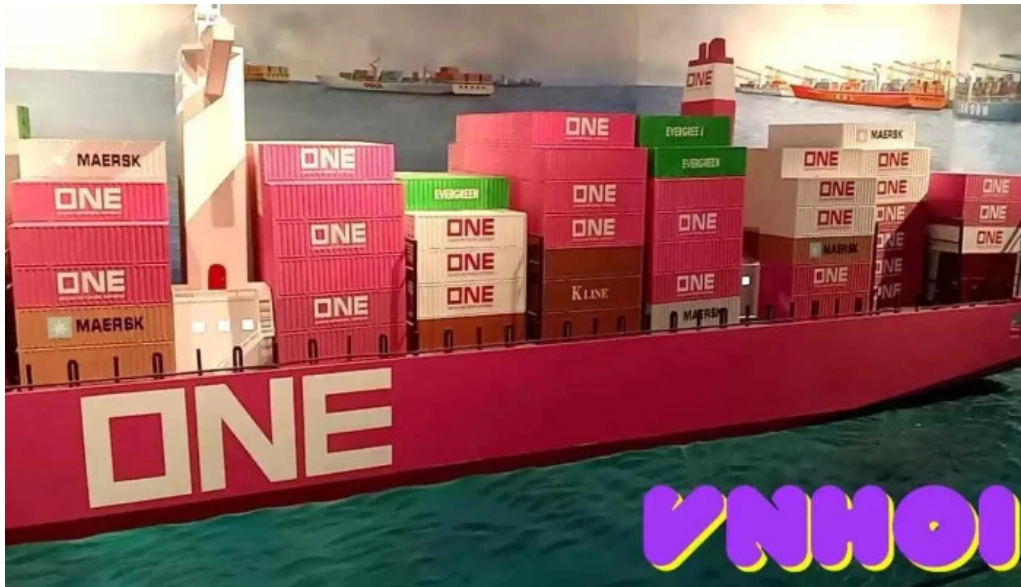
Bao tang ba ria vung tau video