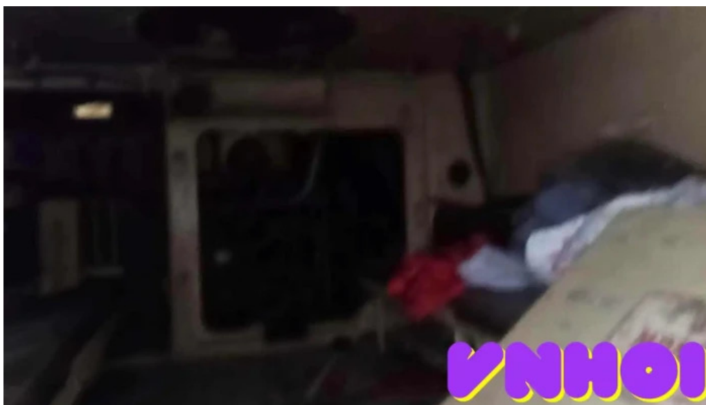
Bao tang luc luong tang thiet giap video