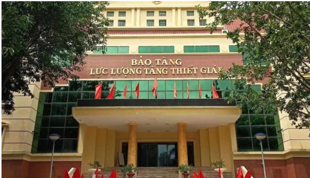
Bao tang luc luong tang thiet giap tat ca