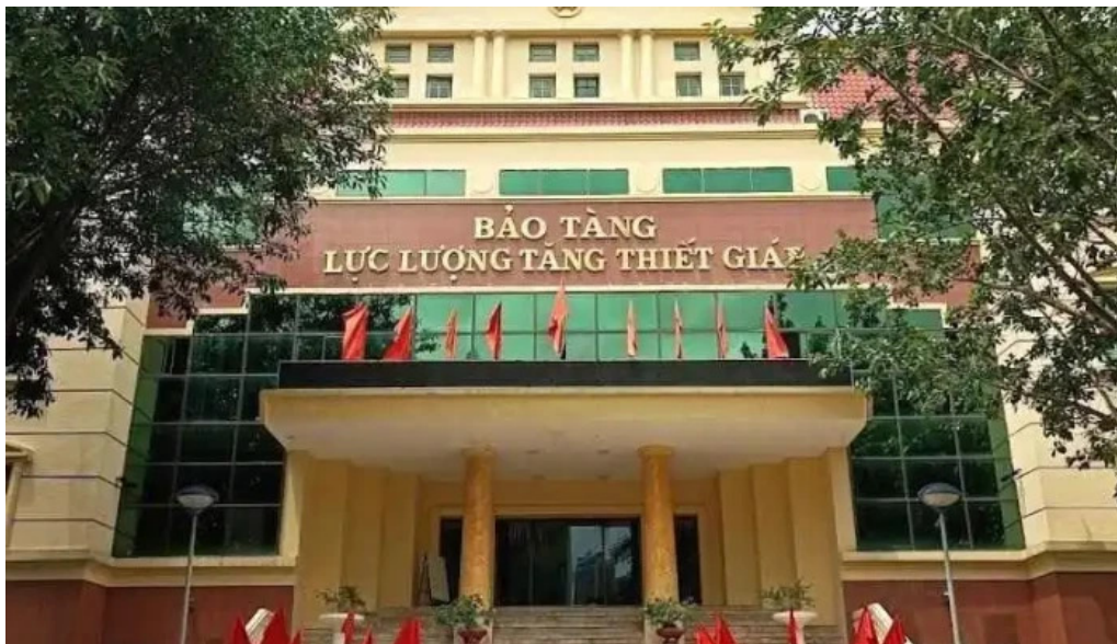
B?o tang l?c l??ng t?ng thi?t giáp ha n?i