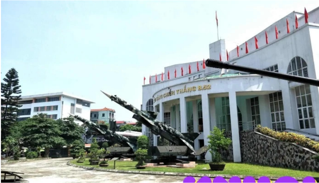
Bao tang chien thang b 52 tat ca