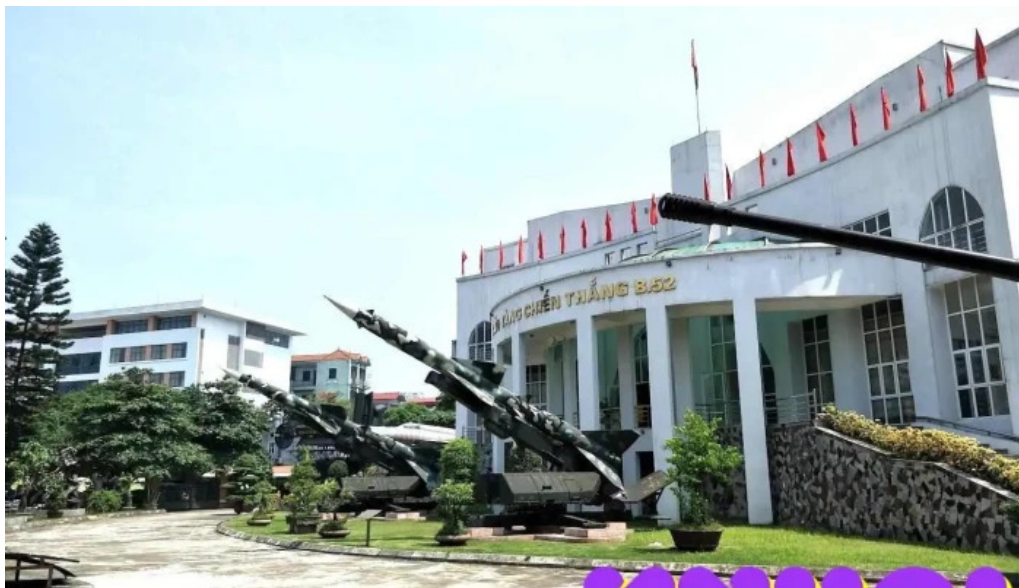
B?o tang chi?n th?ng b 52 ha n?i