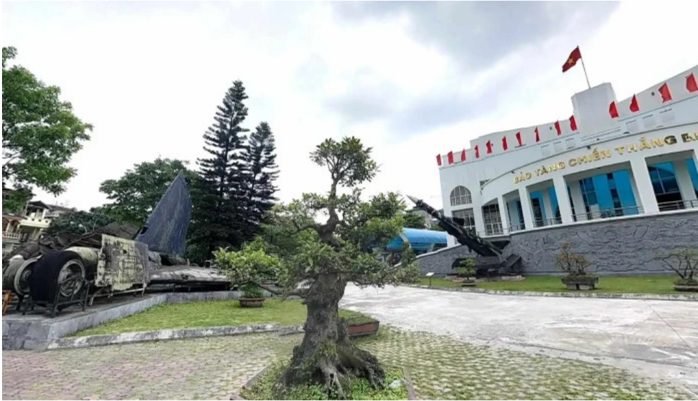
Bao tang chien thang b 52 che do xem pho va 360deg