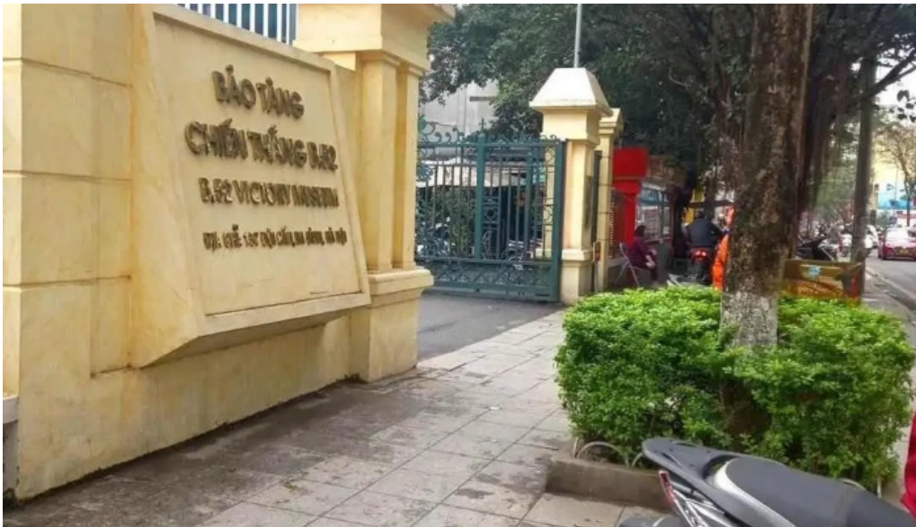
Bao tang chien thang b 52 moi nhat