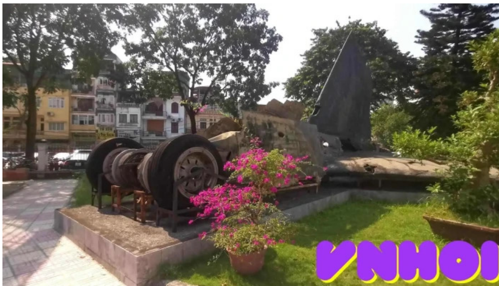
Bao tang chien thang b 52 video