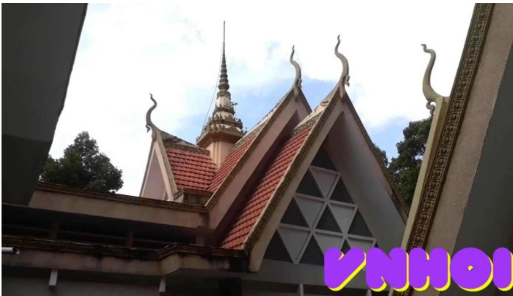
Bảo tàng văn hóa dân tộc khmer video