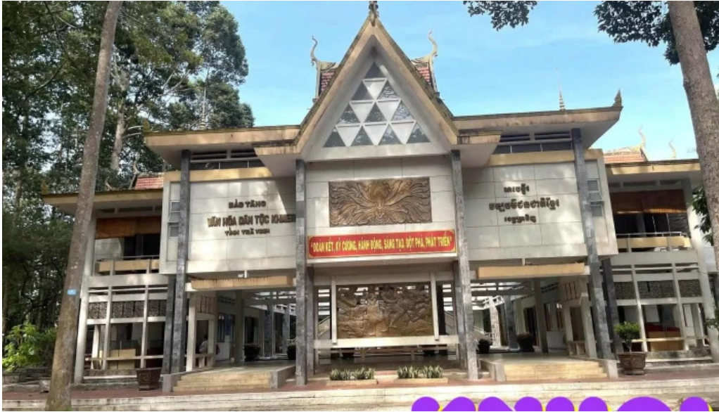
Bao tang van hoa dan toc khmer tat ca