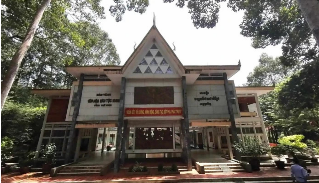
Bao tang van hoa dan toc khmer che do xem pho va 360deg