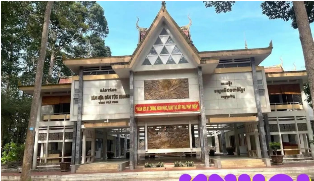
Bảo tàng văn hóa dân tộc khmer tra vinh