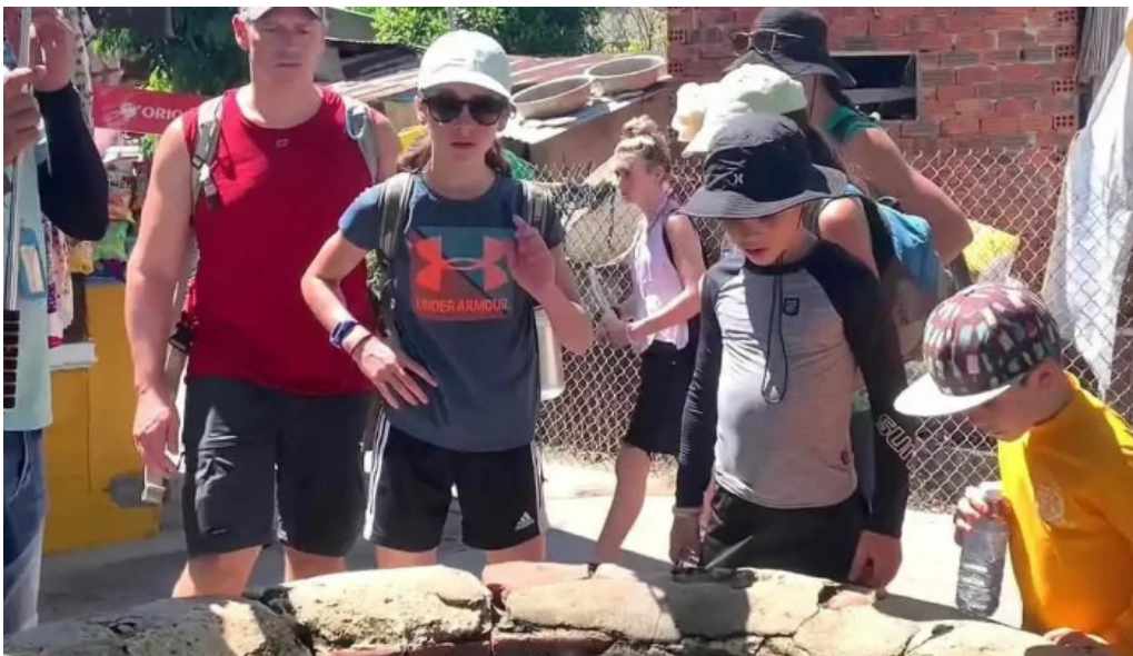
Gieng cham co video