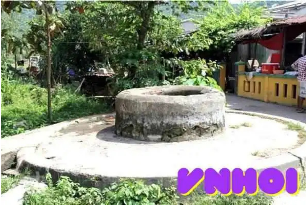
Gi?ng ch?m c? qu?ng nam