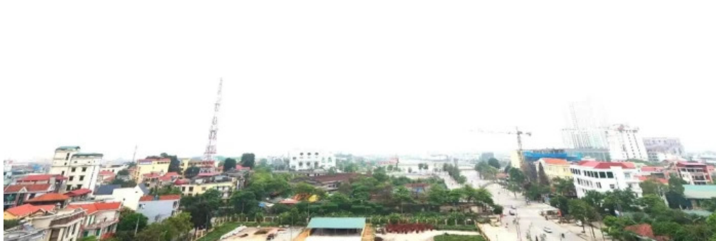
Bao tang hung vuong che do xem pho va 360deg