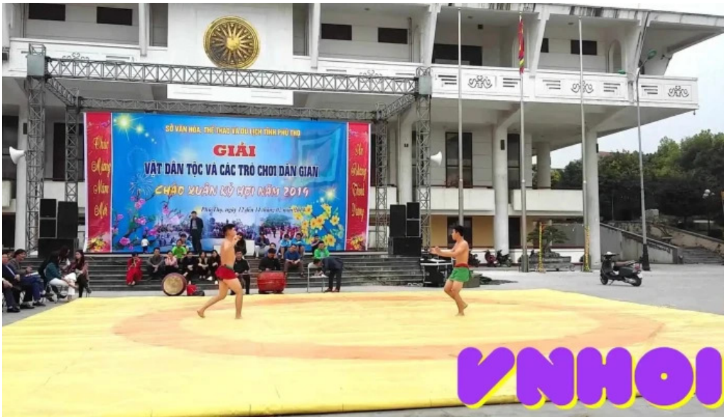
Bao tang hung vương video