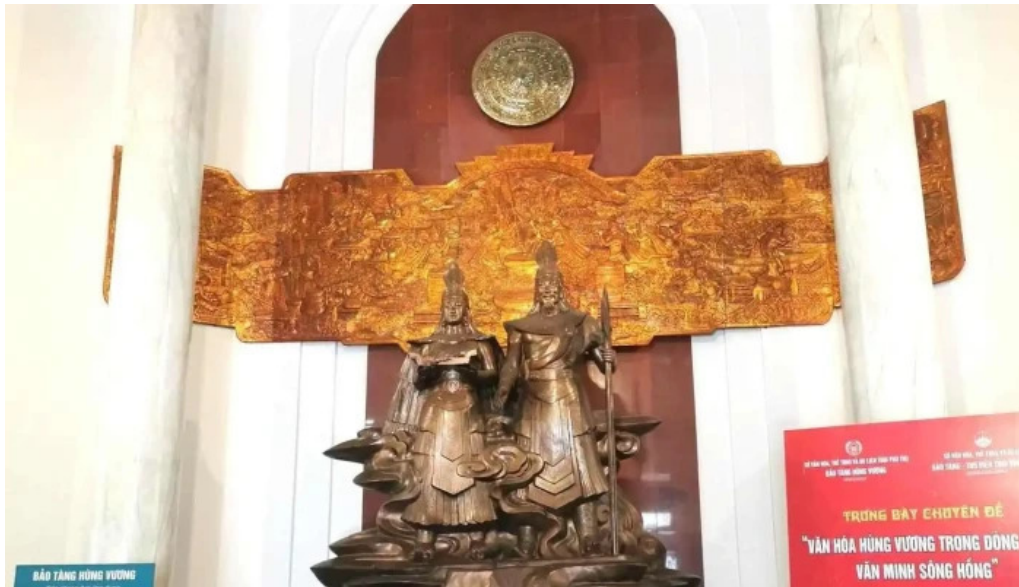
BẢO TÀNG HÙNG VƯƠNG

TRUNG BÀY CHUYÊN ĐỀ "VĂN HÓA HÙNG VƯƠNG TRONG ĐÔNG VĂN MINH SÔNG HỒNG"