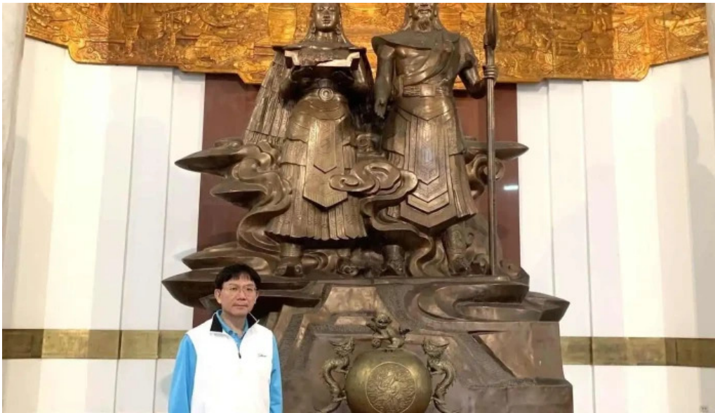
Bao tang hung vương tat ca