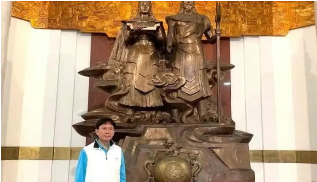
B?o tàng hùng v??ng phu th?