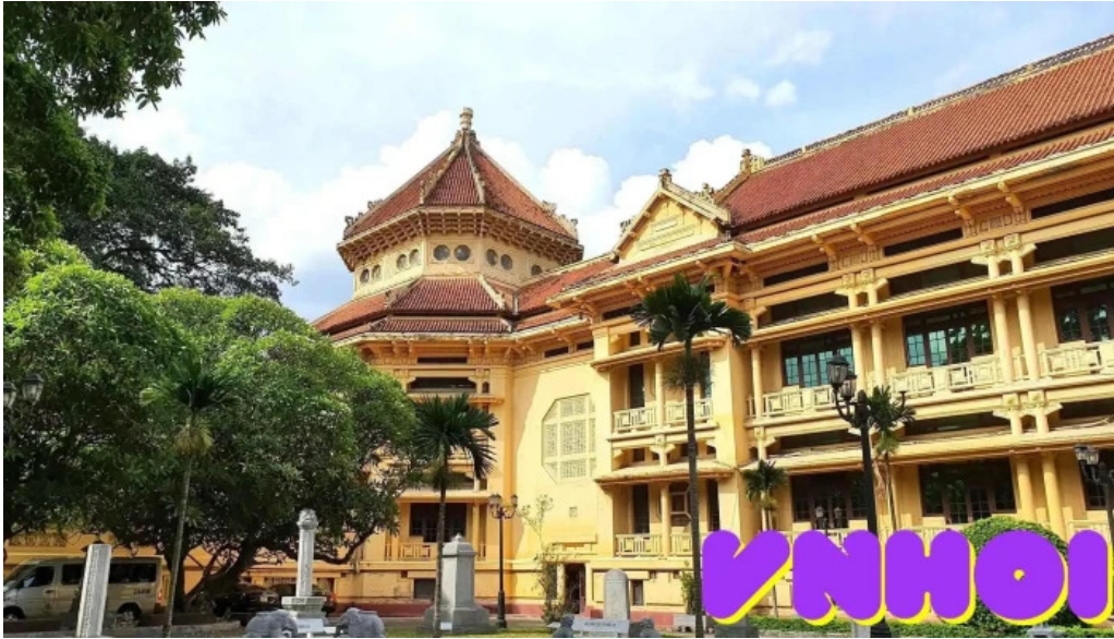
Bao tang lich su quoc gia tat ca