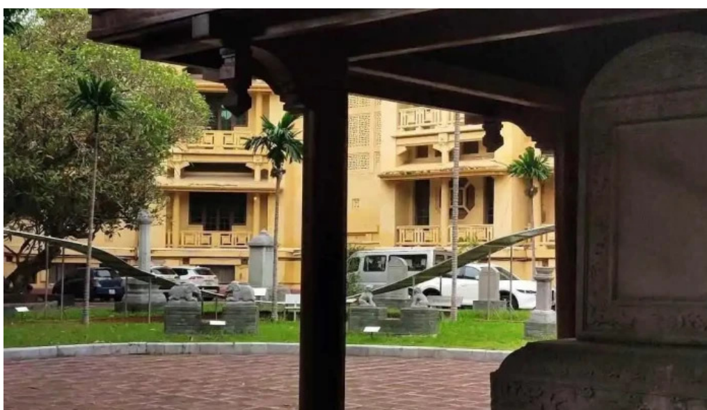
Bao tang lịch sử quốc gia video