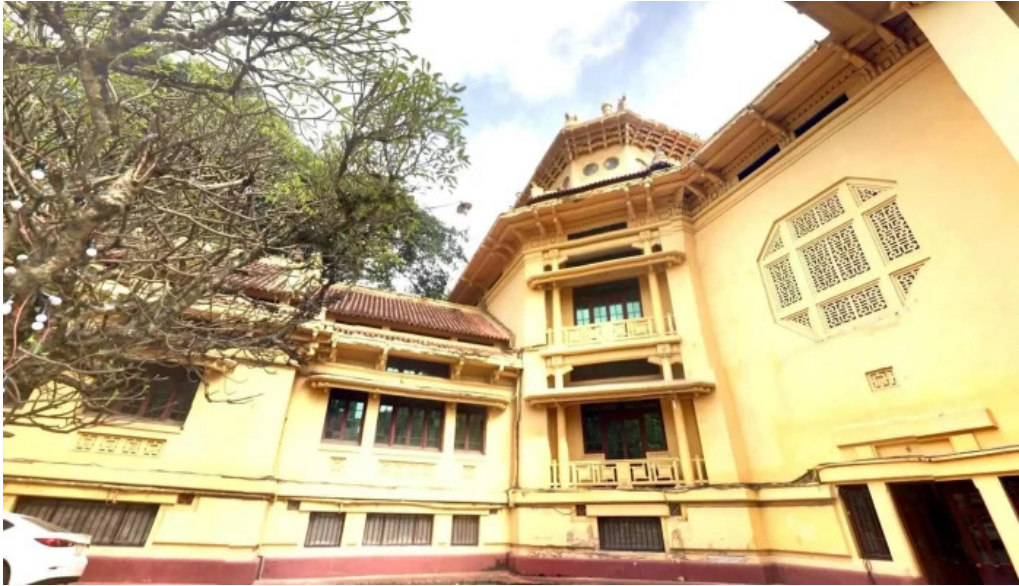
Bao tang lịch sử quốc gia che đò xem phò và 360deg