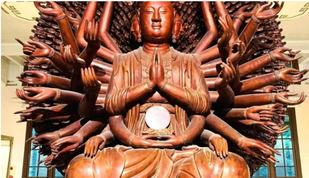
Bao tang lich su quoc gia moi nhat