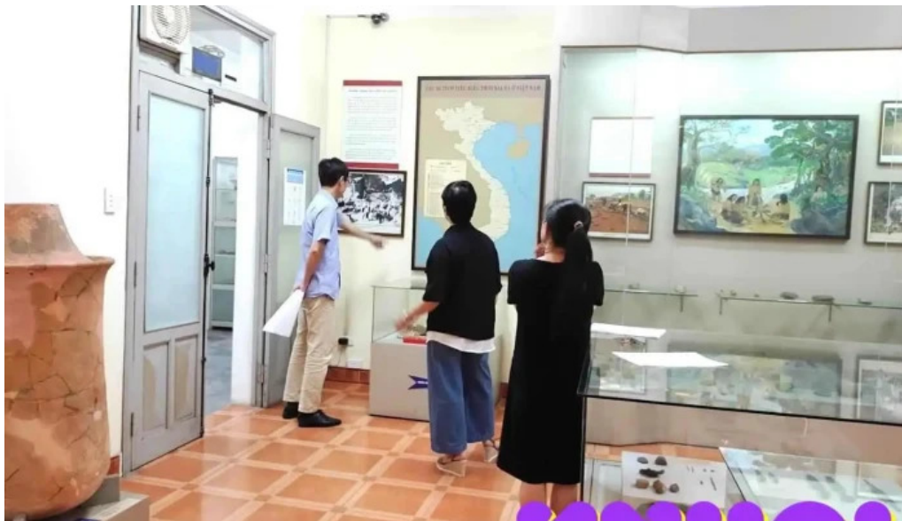
B?o tàng nhân h?c hà n?i