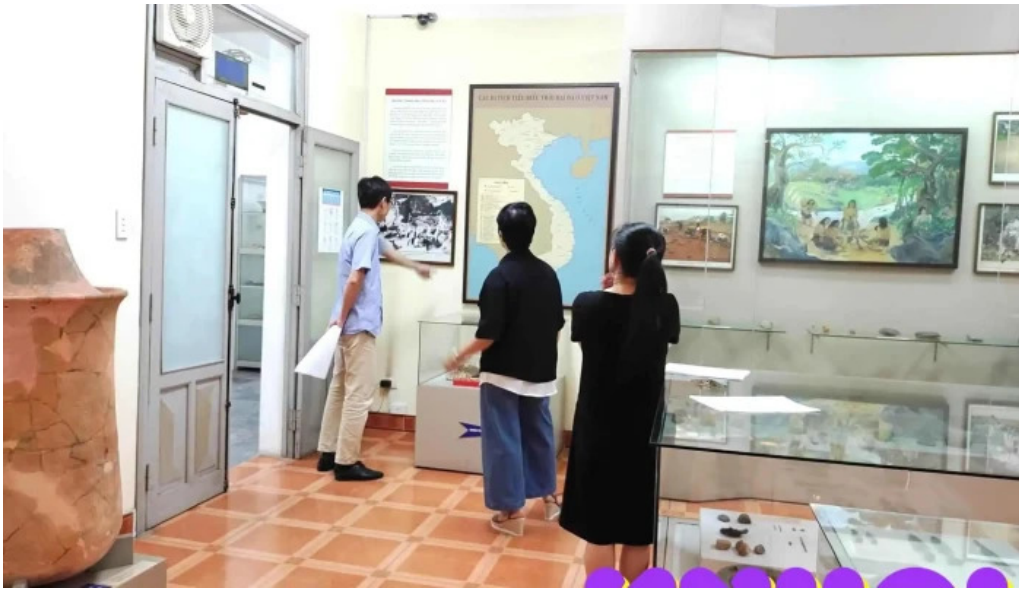
Bao tang nhan hoc tat ca