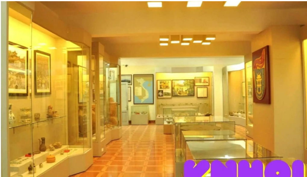
Bao tang nhan hoc cua chu so huu