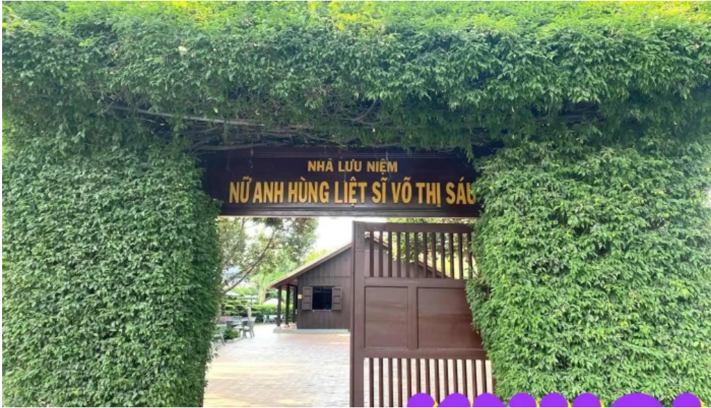
Nha luu niem vo thi sau tat ca