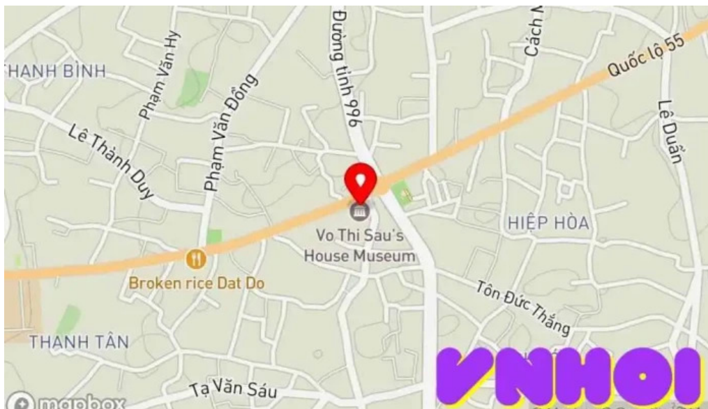
Nha luu niem vo thi sau b?n ??