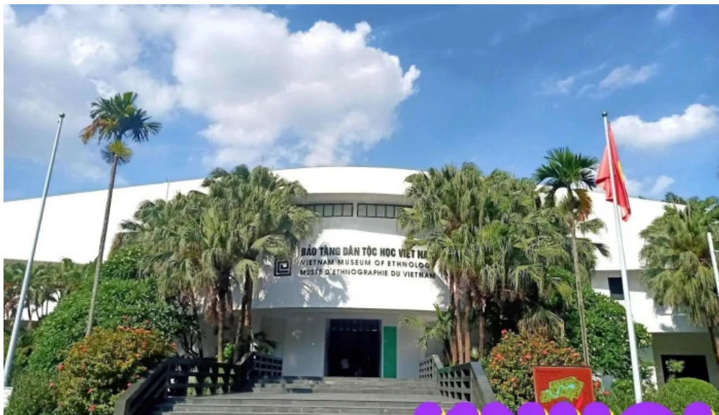
Bao tang dan toc hoc viet nam tat ca