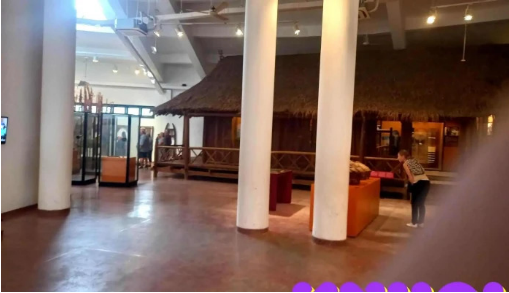
Bao tang dan toc hoc viet nam moi nhat