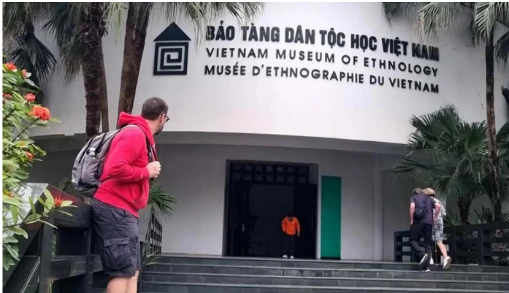
Bao tang dan toc hoc viet nam video