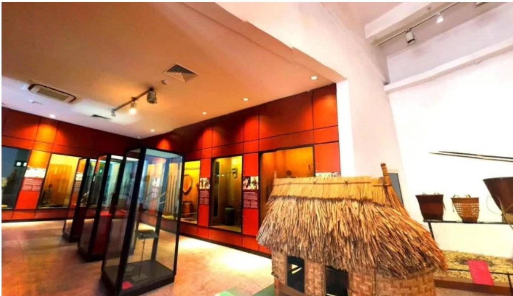
Bao tang dan toc hoc viet nam che do xem pho va 360deg