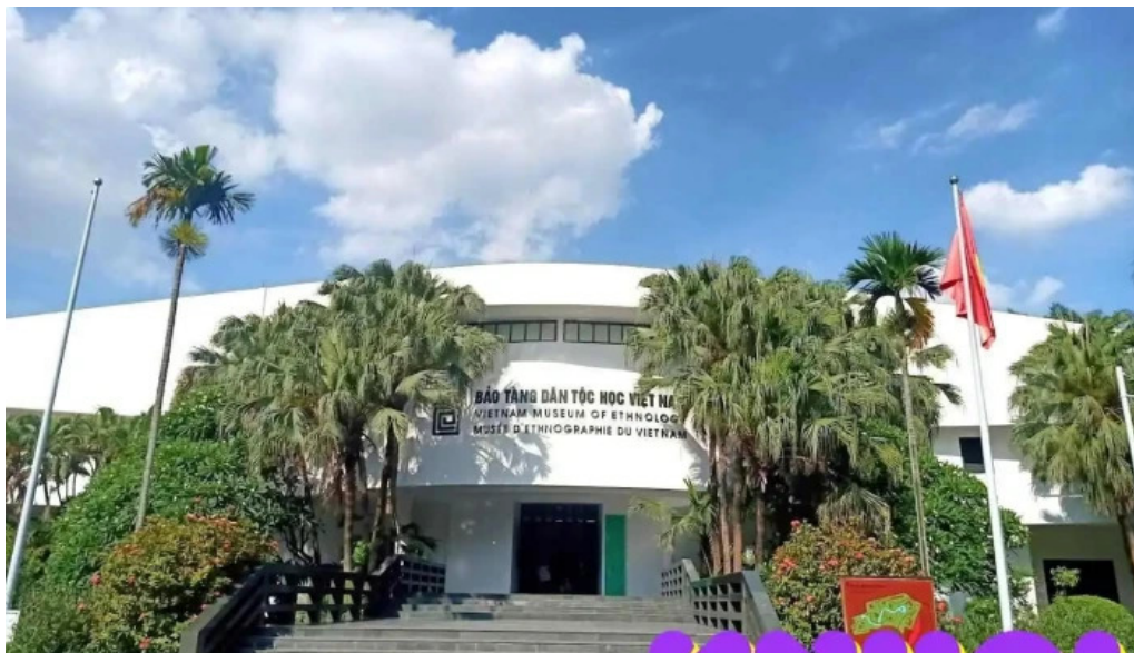
B?o tang dan t?c h?c vi?t nam ha n?i