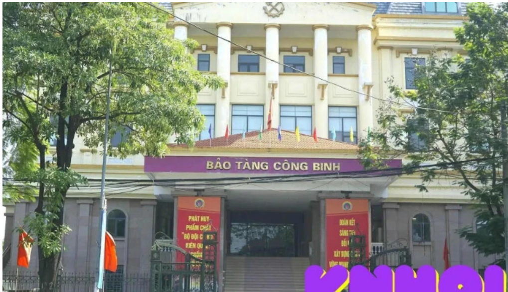
Bao tang cong binh tat ca