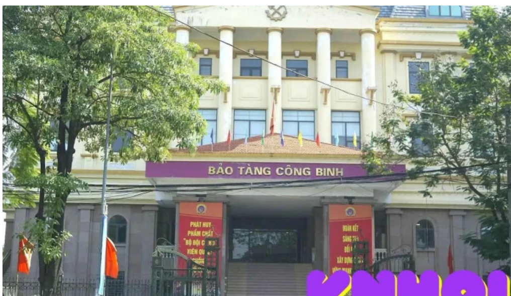
B?o tang cong binh ha n?i