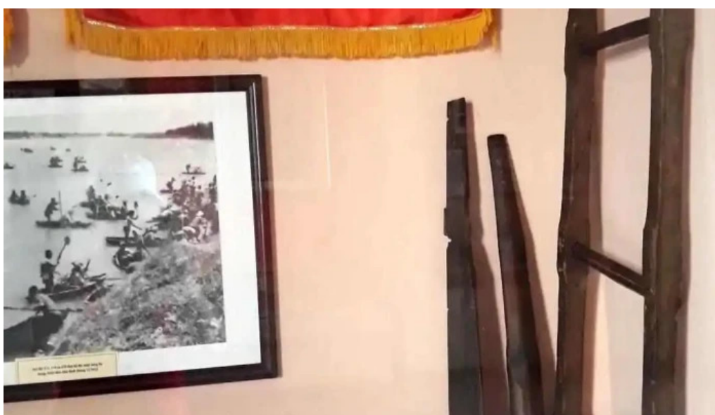
Bao tang cong binh video