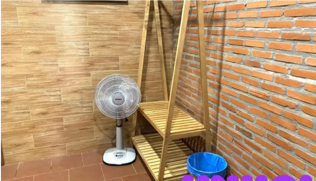
Nha go phuoc tan ho tram cua chu so huu