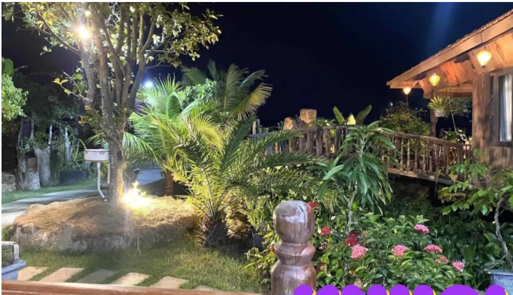
Nha go phuoc tan ho tram tat ca