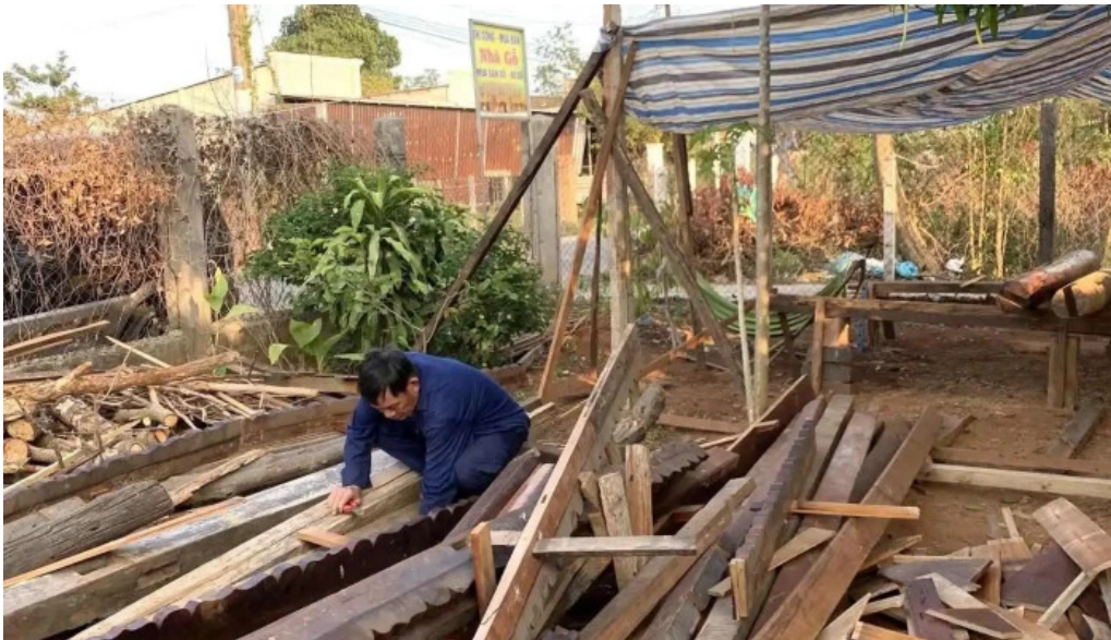
Nha go phuoc tan ho tram cua khach tro