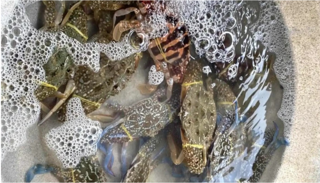
Nha go phuoc tan ho tram thuc pham va do uong