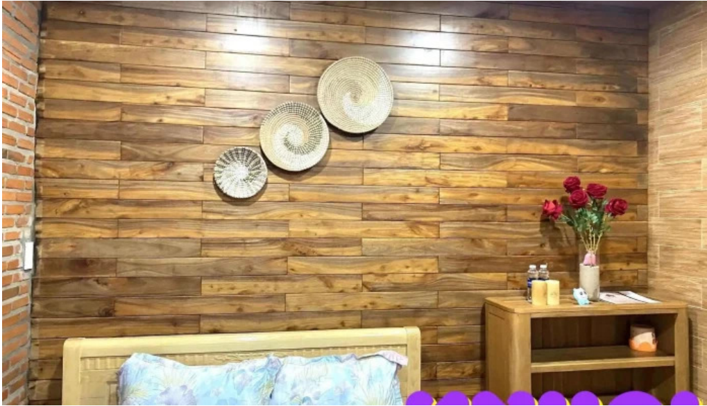
Nha go phuoc tan ho tram phong