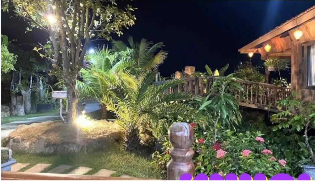
Nha g? ph??c tan h? tram ba r?a v?ng tau