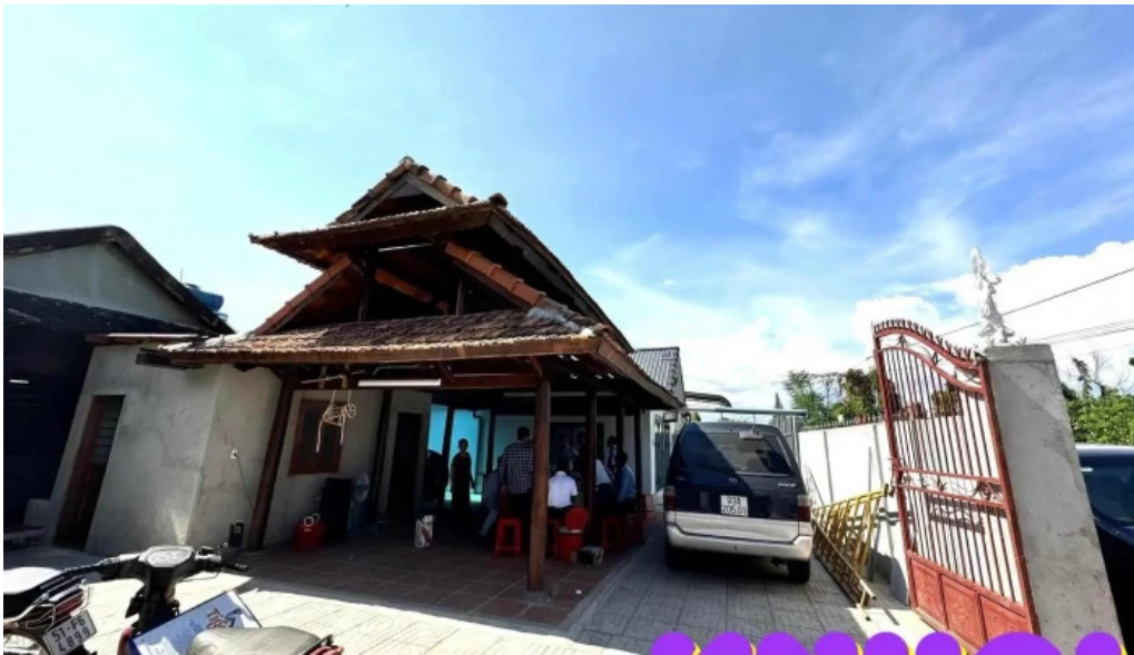
Nha go phuoc tan ho tram ngoai that