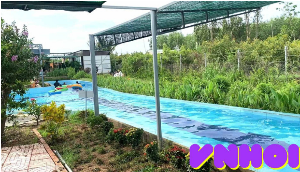
Nha go phuoc tan ho tram video