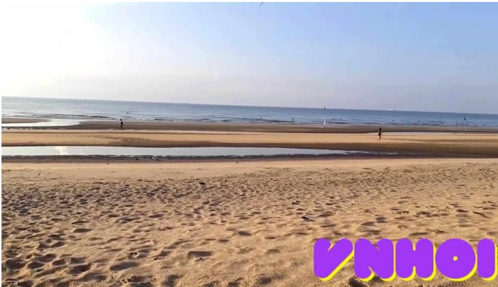
Khu du lich gio bien vung tau video