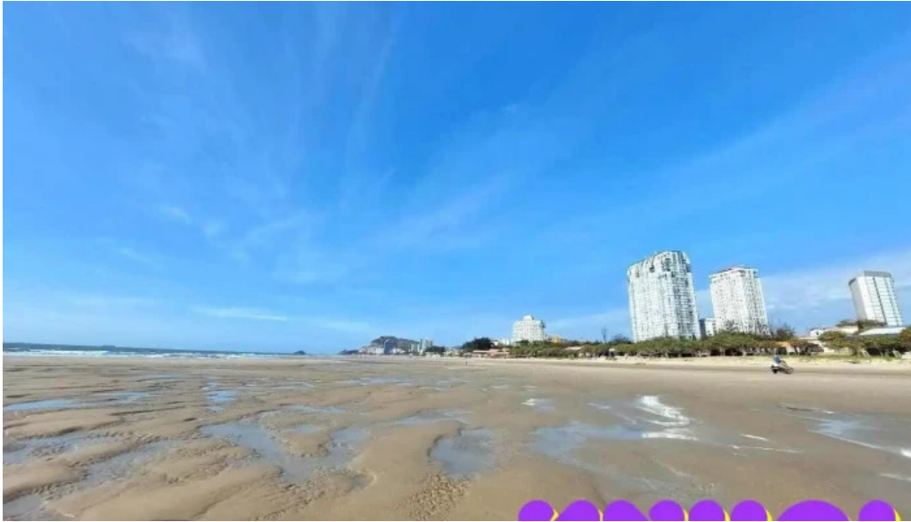
Khu du l?ch gio bi?n v?ng tau ba r?a v?ng tau