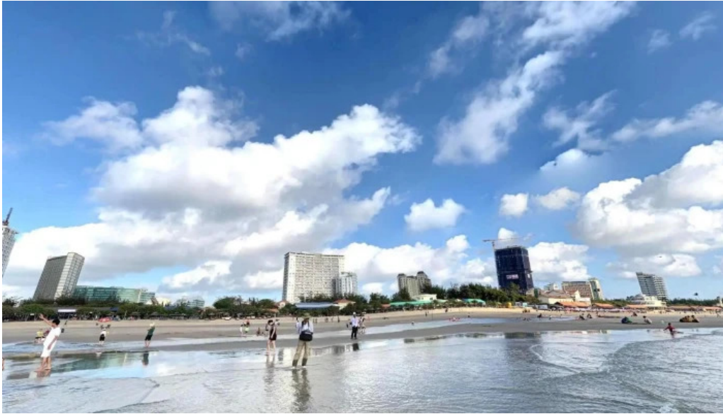
Khu du lịch gió biển vùng tau che do xem pho va 360deg