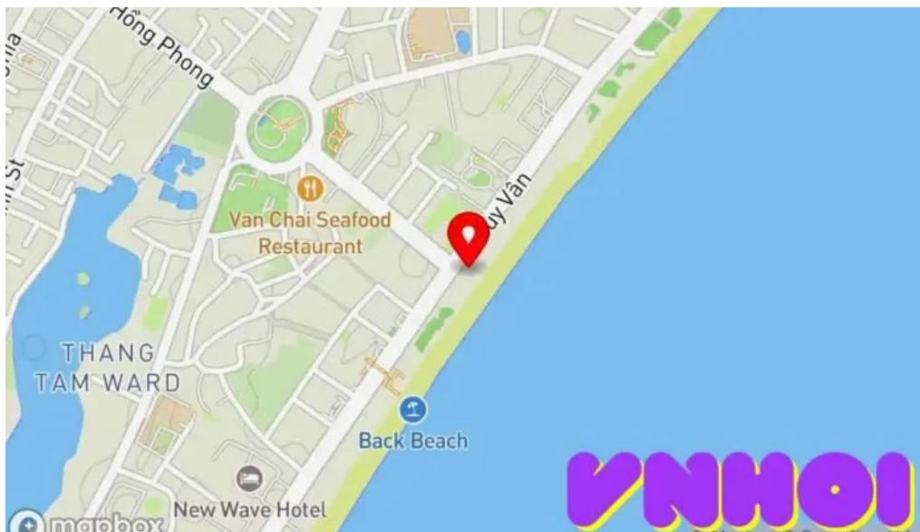
Khu du lịch gió biển vùng tau b?n ??