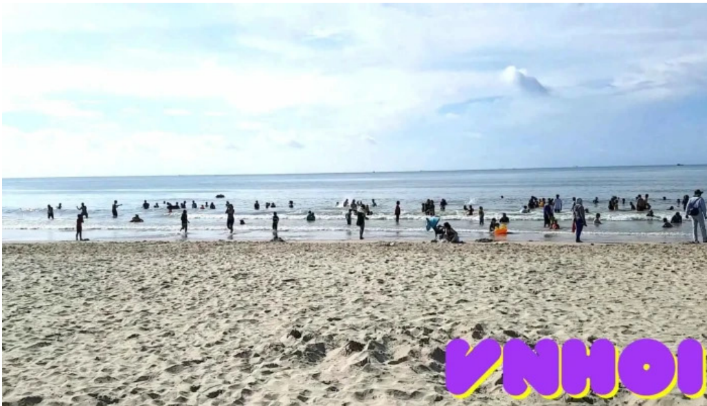
Khu du lịch gió biển vùng tau cat