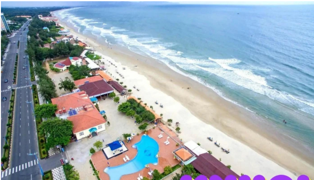
Khu du lịch gió biển vùng tau của chủ sở hữu