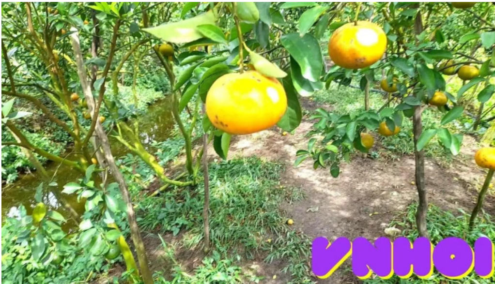
Quyt hong lai vung video