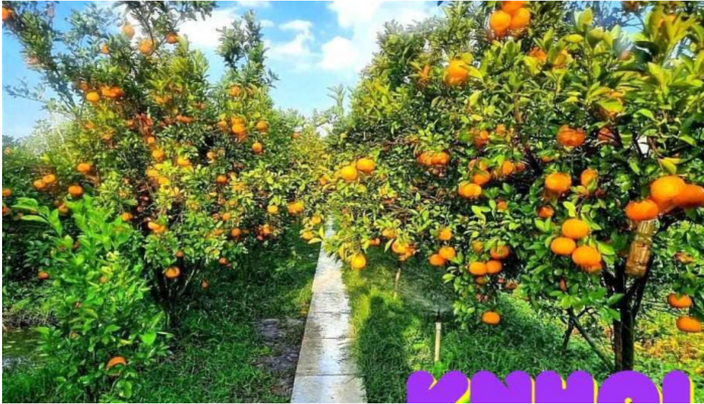
Quy hoạch lại vùng tất cả